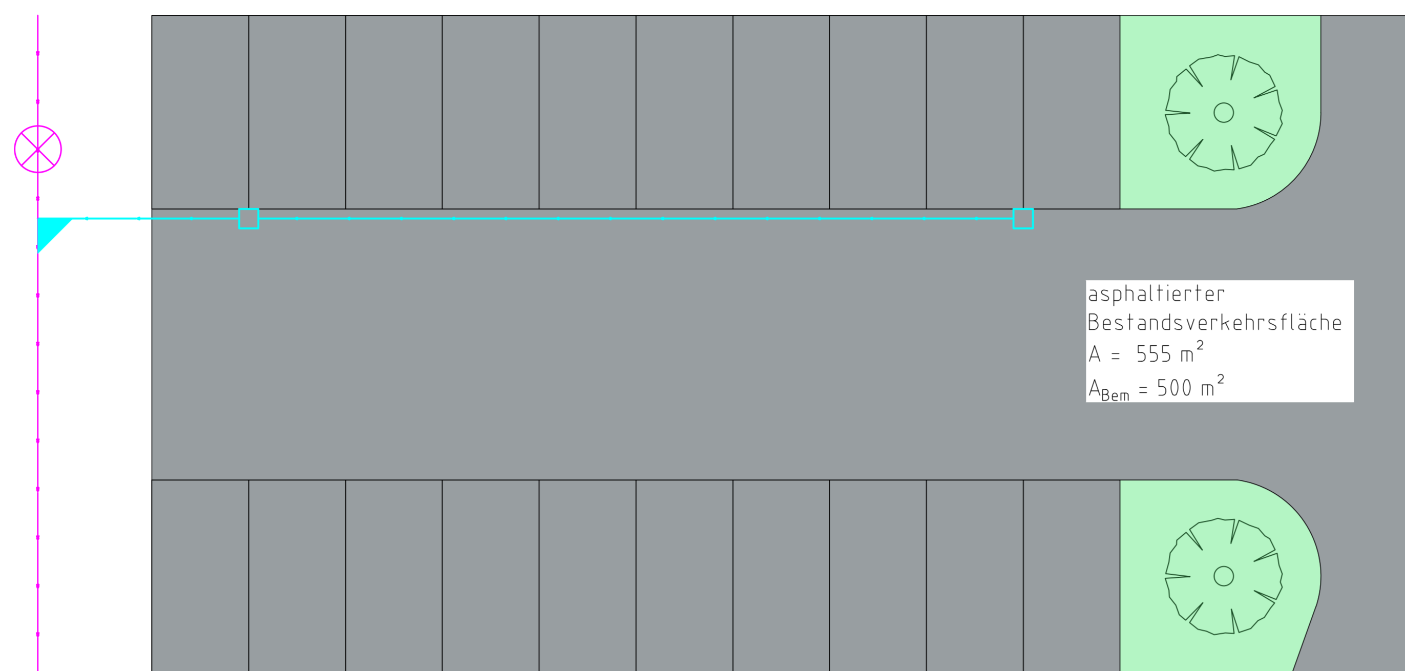
Lageplan, M 1:100 Abkopplung eines Parkplatzes vom Mischwasserkanal mittels Rigole, Investitionsszenario 3