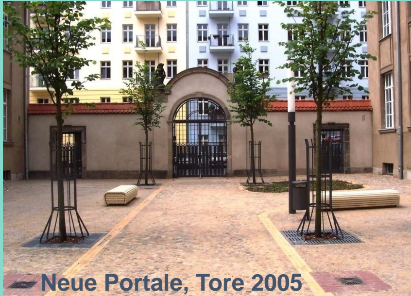
Neue Portale, Tore 2005