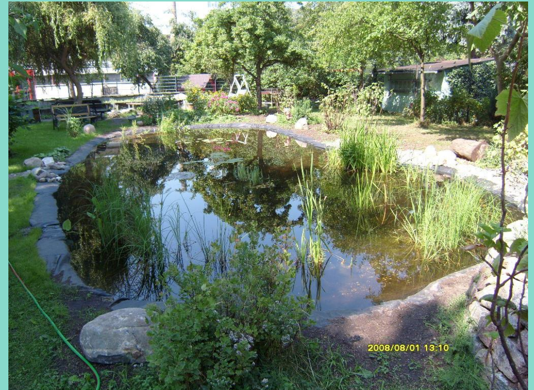
Teich im Schulgarten, 2008