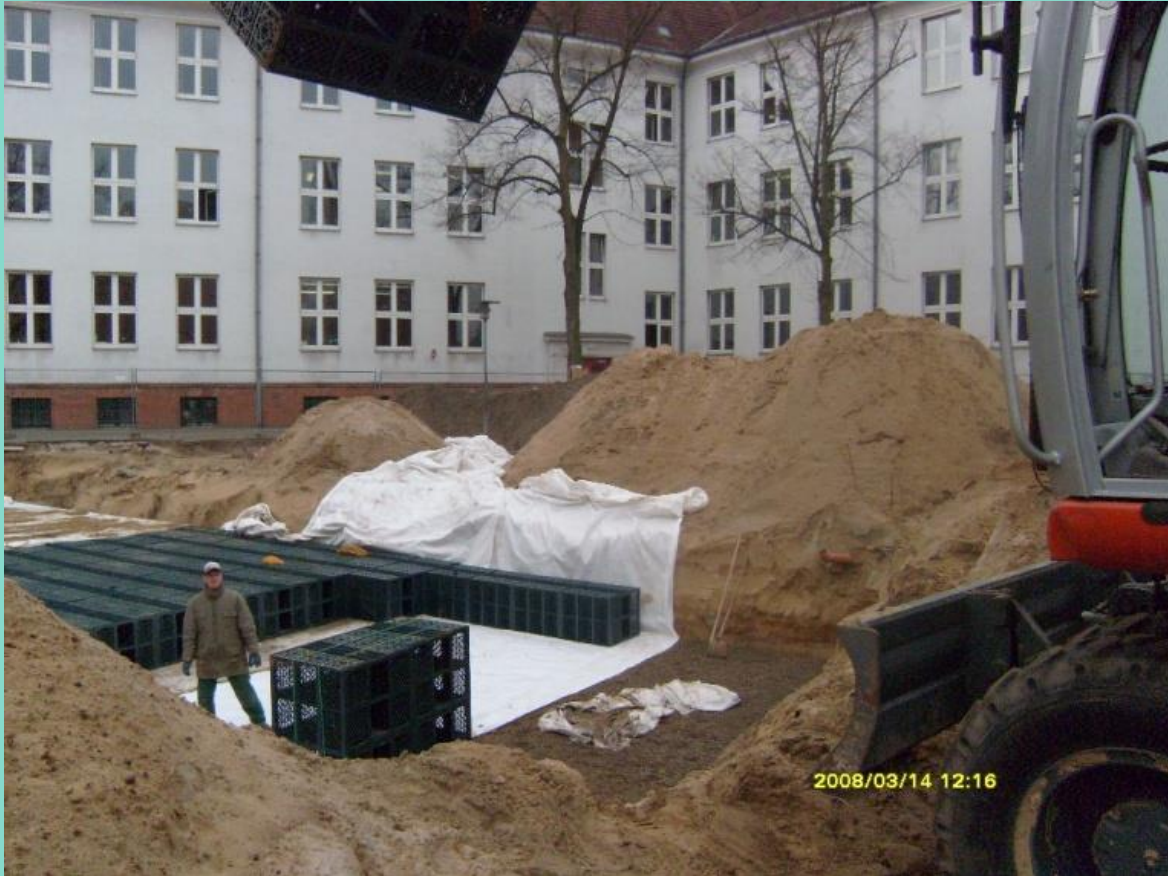
Rigoleneinbau unter Sandspielfläche, 2008