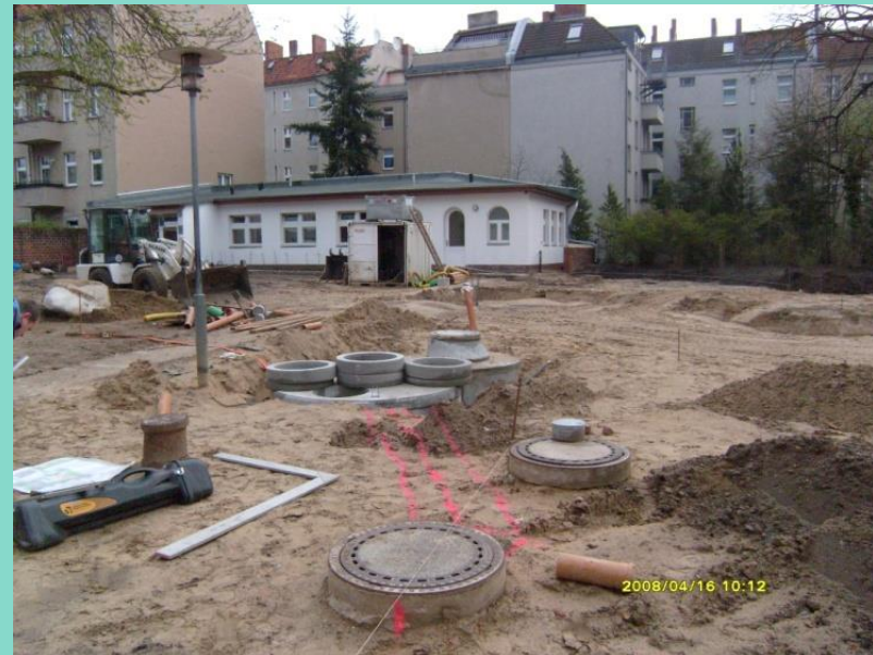
Setzen neuer Schächte, 2008