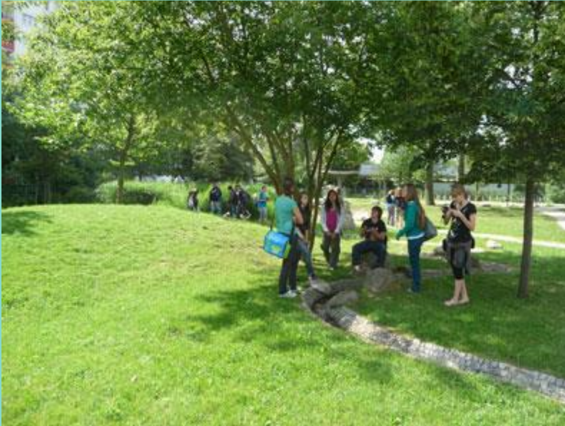
„Landschaft“ mit Hügeln und Wasserläufen, 2008