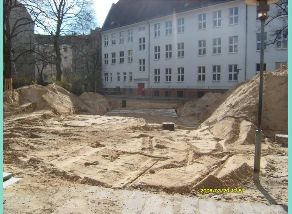
Spielsandauffüllung über Rigole, 2008