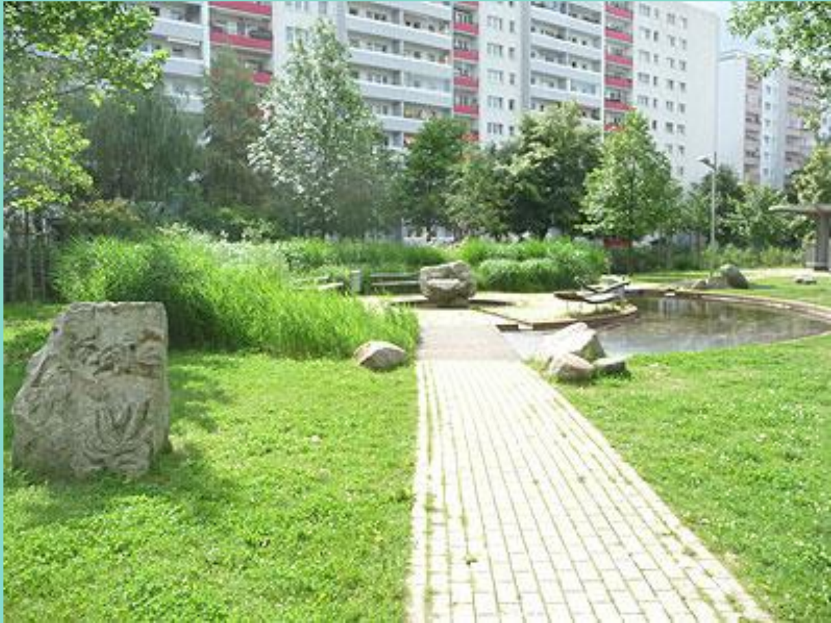
Blick auf das große Wasserbecken, 2008