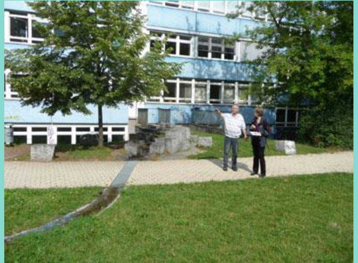
Zustand ca. 2005