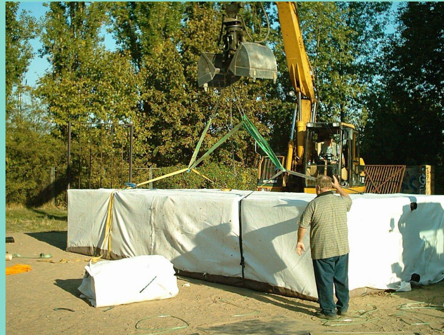
Lieferung, Einbau Zisterne, 2005