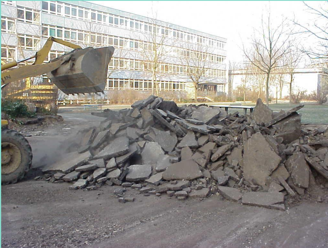
Abrissarbeiten Dez 2002