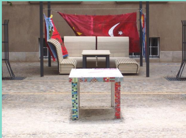
Neue Möbel, gefliester Tisch, 2005