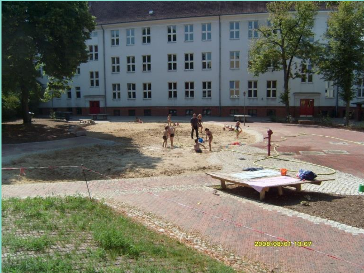
Spielfläche über Rigole, 2008