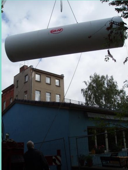
Zisterne 2. Hof