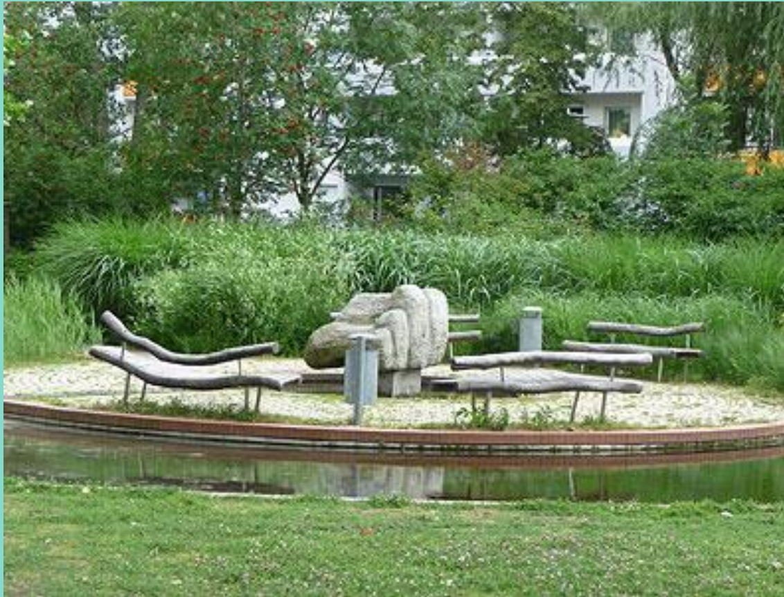
Großes Wasserbecken, 2008