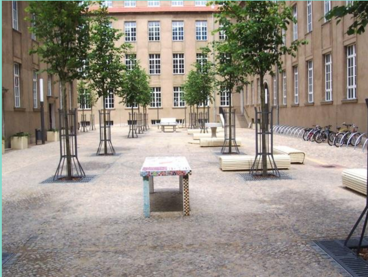
Blick in den Innenhof, 2005