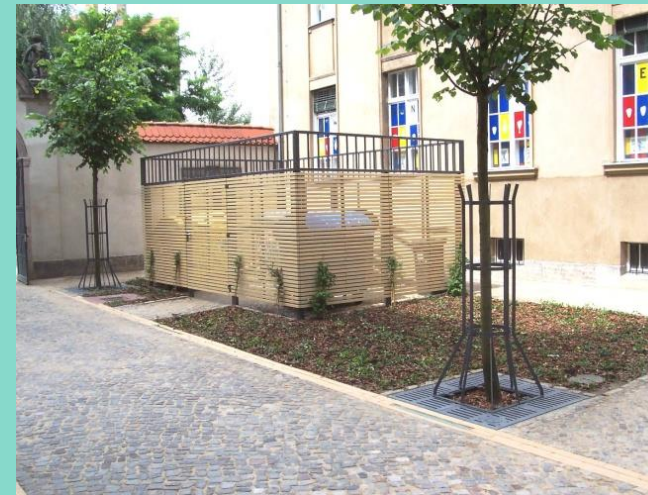
Neuer Müllstandort, 2005