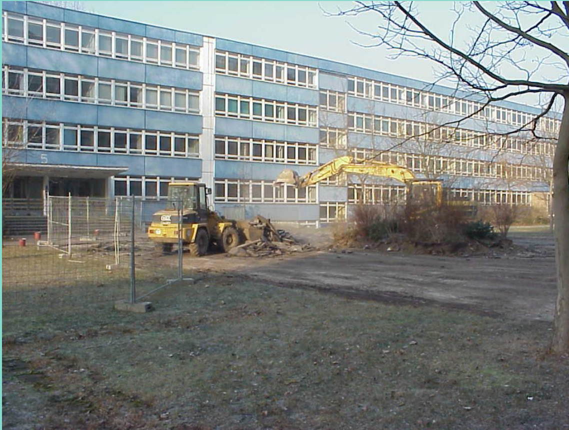
Abrissarbeiten Dez 2002